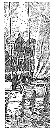
Obra de Pacheco.

11 horas: Expo checo Altamiranc huano", del artista Pacheco Altamira Marina, Ifarle Or Brisa del Sol, Talc 11 horas: XXI