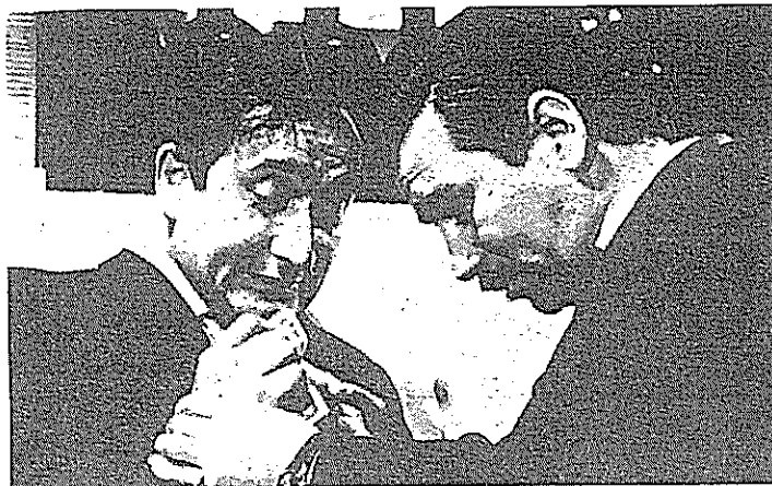
El cine de Raúl Ruiz tiene un fundamento clave en el TUC, donde va a conocer a quienes protagonizan películas como "Tres tristes tigres", 1968.

"Además de aludir a dos de sus películas, el libro se concentra en la energía desesperada de los personajes de Raúl más allá de los protagonistas de 'Tres tristes tigres' (piénsese en el marinero de 'Las tres coronas del marinero' (1983), el Proust de 'El tiempo recobrado' (1998) o en el multifacético padre Dinis de 'Misterios de Lisboa'). Su humor comparte esta tensión en los chistes serios, la sátira que combina risa y llanto", apuntaron.